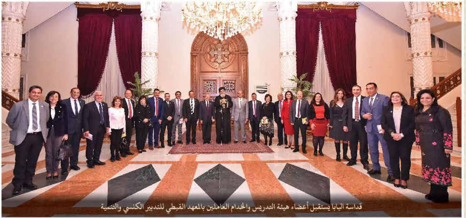
قداسة البابا يستقبل أعضاء هيئة التدريس والخدام العاملين بالمعهد القبطي للتدريب الكنسي والتصميم