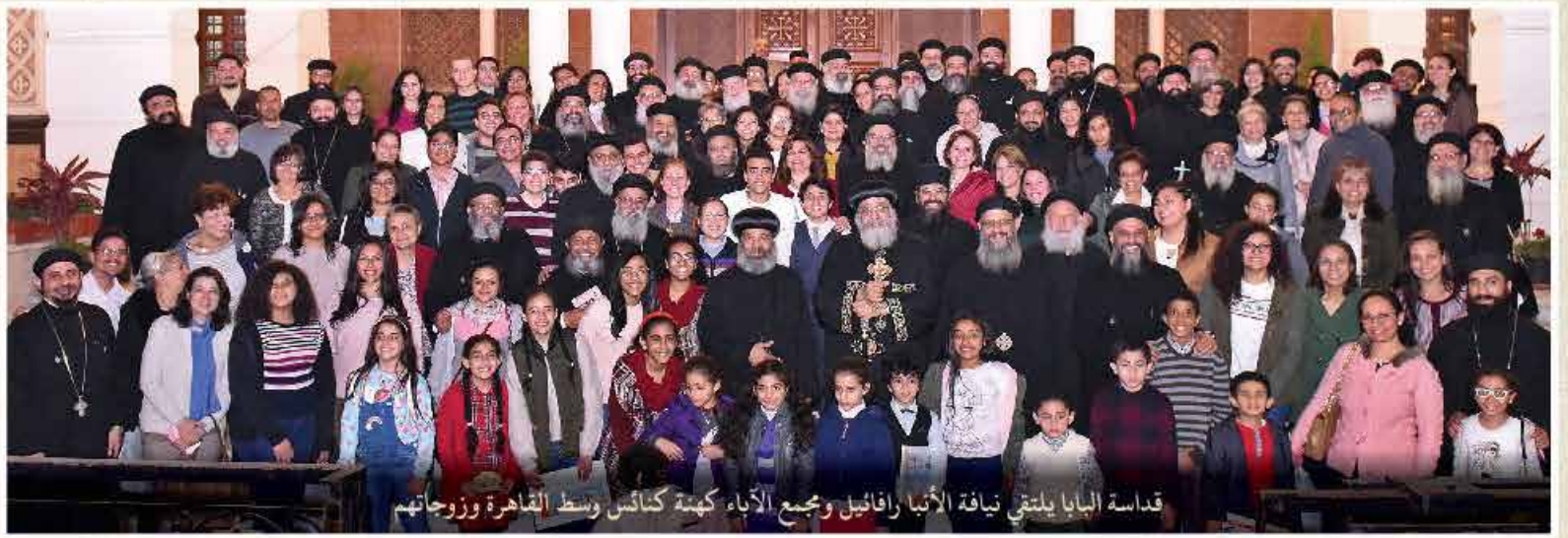
قداسة البابا يلتقي نيافة الأنبا رافائيل ومجمع الآباء كهنة كنائس وسط القاهرة وزوجاتهم