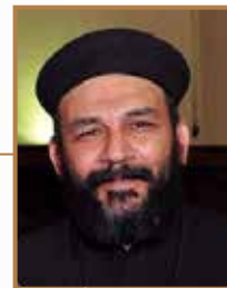
القسم باسيليس صبحي كريمة السيرة العذراء بالزيوت

للمرة الأولى في التاريخ، وذلك في جلسة مجلس النظار (الوزراء) بتاريخ ٧ أبريل سنة ١٩٠٧م، بشرط أن لا ينقص عددهم عن ١٥ تلميذاً للديانة الواحدة بالمدرسة الواحدة. وأن يكون التدريس لهم بمعرفة من يدين بدينهم من مدرسي المدرسة إن وُجد، وإلا فبمعرفة أشخاص من المشتغلين بالدين ويكون انتخابهم بمعرفة رؤساء الديانة التابعين لها. ومن ثم أصدر قداسة البابا كيرلس الخامس منشوراً بطريركياً في بابه ١٦٢٤ اش الموافق أكتوبر ١٩٠٧م، أولاً تهنئة أبناء الكنيسة بمناسبة حصولهم على هذه المنّة التي طالما تآقت إليها النفوس... ثانياً يحثهم على اغتنام هذه الفرصة وأن يقدموا لنظار مدارسهم طلباً يُصرحون فيه برغبتهم لتعلم ديانتهم... وبالتالي عندما وصلت الطلبات لقداسة البابا نظر في ترتيب المعلمين اللازمين وتقرير المواد (المناهج) التي يلزم تدريسها... ومن هذا المنشور نفهم أن أمر تدريس الدين بالمداس الأميرية بعد اعتماده من مجلس النظار (الوزراء)، صار ملقى على عاتق الكنيسة، سواء من جهة توفير المدرسين المناسبين للقيام بهذه