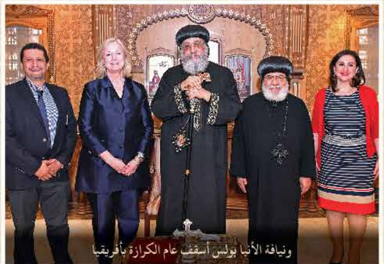
ونيافة الأنبا بولس أسقف عام الكرازة بأفريقيا