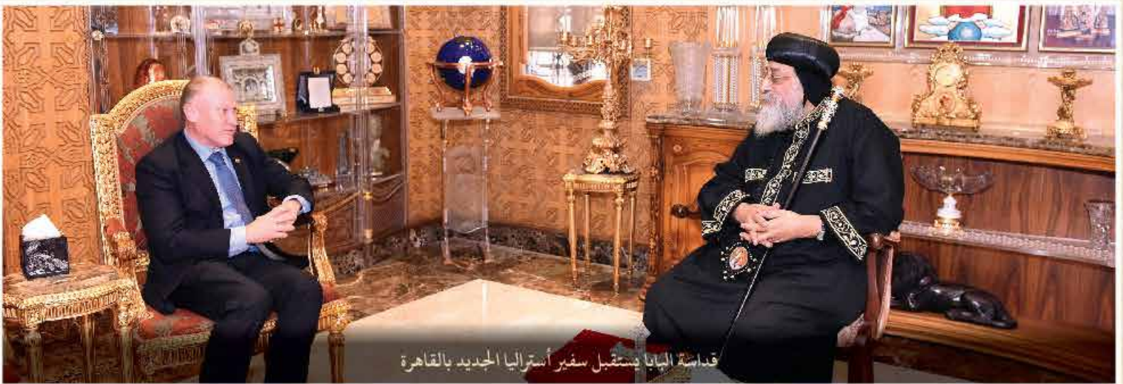
قداسة البابا يستقبل سفير أستراليا الجديد بالقاهرة