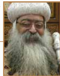
نيافة الأنبا تكلا أسقف دشنا