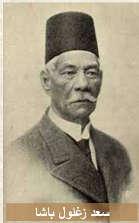
سعد زغلول باشا

بمناسبة الإحتفال بمئوية ثورة سنة ١٩١٩م، نتذكر الزعيم الوطني سعد باشا زغلول. ذلك الرجل الذي في عهد نظارته لنظارة (وزارة) المعارف العمومية (التربية والتعليم) في الفترة من ٢٨ أكتوبر ١٩٠٦ إلى ٢٣ فبراير ١٩١٠م، وفي عهد نظارة دولة رئيس مجلس النظار (الوزراء) مصطفى فهمي باشا (للمرة الثالثة) في الفترة من ١٢ نوفمبر ١٨٩٥م إلى ١١ نوفمبر ١٩٠٨م. كوّن سعد باشا مجلساً أعلى للمعارف مؤلفاً من أفضل علماء الدولة وأنبغهم وأنبغهم، ومن ضمن هؤلاء كان مرقص بك سميكة الذي كان عضواً في المجلس الملّي ورئيس لجنة المدارس القبطية. ولما بلغ لسيادته اشتياق المسيحيين واليهود أن يُدرّسوا دينهم لأولادهم بالمدارس الأميرية (الحكومية)، سواء عن طريق المطالبة بذلك في جرائدهم التي كانت تصدر آنذاك، أو عن طريق أعيانهم المقربين من الساسة وأولي الأمور بالبلاد. فبذل سعد زغلول باشا جهداً حسيباً حتى استطاع أن يستصدر أمراً من مجلس النظار يقضي بتعليم الديانة النصرانية للتلاميذ المسيحيين وكذلك الأمر بالنسبة لليهود، بالمدارس الأميرية الابتدائية،