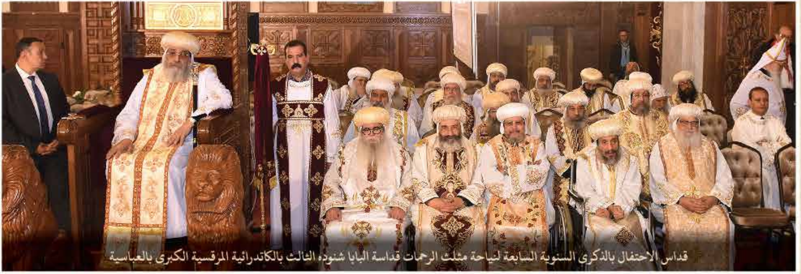
قداس الاحتفال بالذكرى السنوية السابعة لنياحة مثلث الرحمات قداسة البابا شنودة الثالث والكاتدرائية المرقسية الكبرى بالعباسية