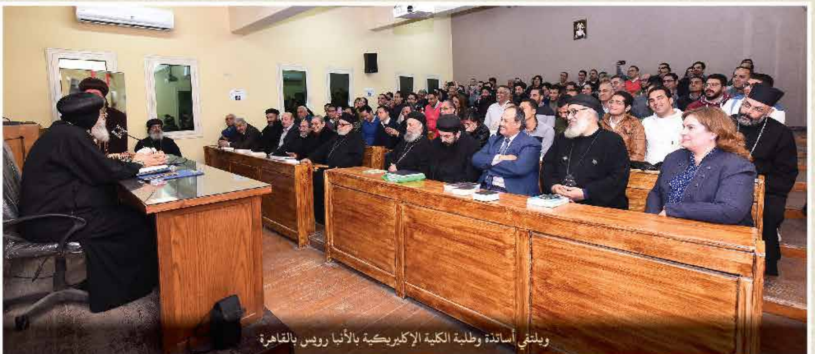
وملتقى أساتذة وطلبة الكلية الإكليريكية بالأبنا رويس بالقاهرة