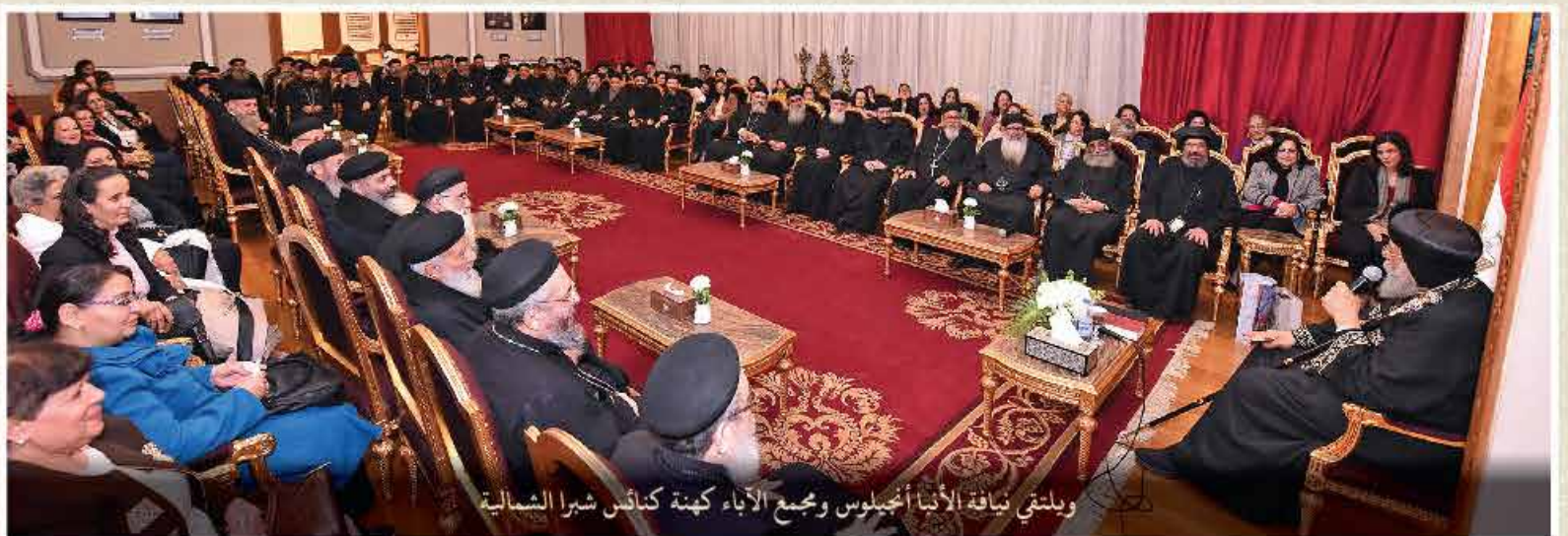
وبلتقي نيافة الأنبا أنجيلوس ومجمع الآباء كهنة كنائس شبرا الشمالية