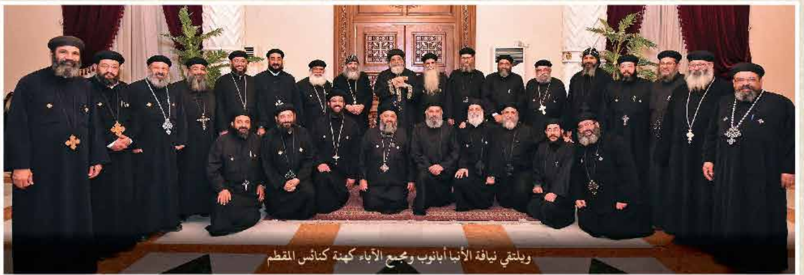
وبلتقي نيافة الأنبا أبانوب ومجمع الآباء كهنة كنائس المقطم