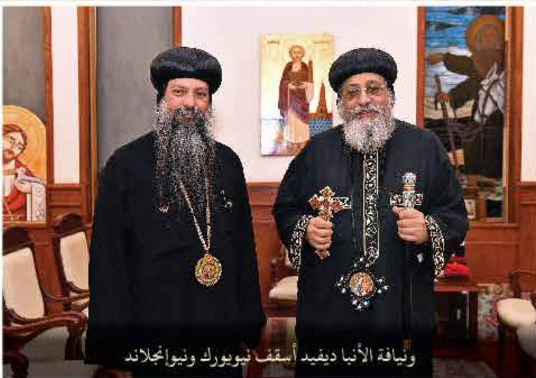
ونيافة الأنبا ديفيد أسقف نيويورك ونيوإنجلاند