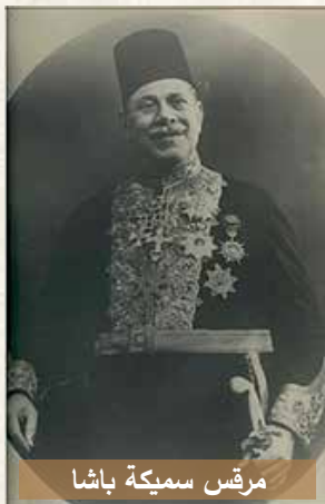
مرقس سميكة باشا