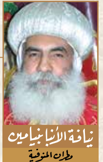
نيافة الأنبا يامين مطران المنوفية

شكلا للكمال شكل عادي وآخر علوي، واحد يُقتنى هنا والآخر فيما بعد، واحد حسب القدرات البشرية والآخر خاص بكمال العالم العتيق، أما الله فعادل خلال الكل، حكيم فوق الكل، كامل في الكل. فمن يبدأ ولا ينمو لا يستطيع أن يدرك ما يود أن يدركه ولا يسعى نحو الغرض.. لذلك فكل عمل روحي له بداية وله تكمله أيضاً، فالصلاة تبدأ بالجسد ثم بالفكر ثم بالروح والذهن ثم بالاستعلانات الإلهية.. الخ. وكذلك في الصوم: صوم الجسد ثم صوم اللسان ثم صوم الفكر ثم صوم الحواس جميعاً.. الخ.. وهكذا بقية الوسائط الروحية... لا بد أن يتحقق فيها النمو ويتحول هذا الجهاد إلى مكافأة كرامة بهية أبدية.