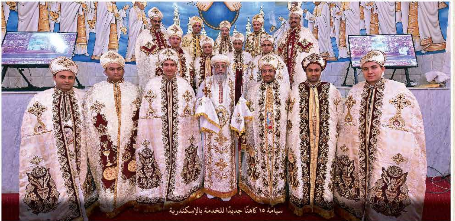
سيامة ١٥ كاهنًا جديدًا للخدمة بالإسكندرية