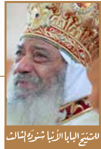
الشيخ البابا الأنبا شنودة الثالث